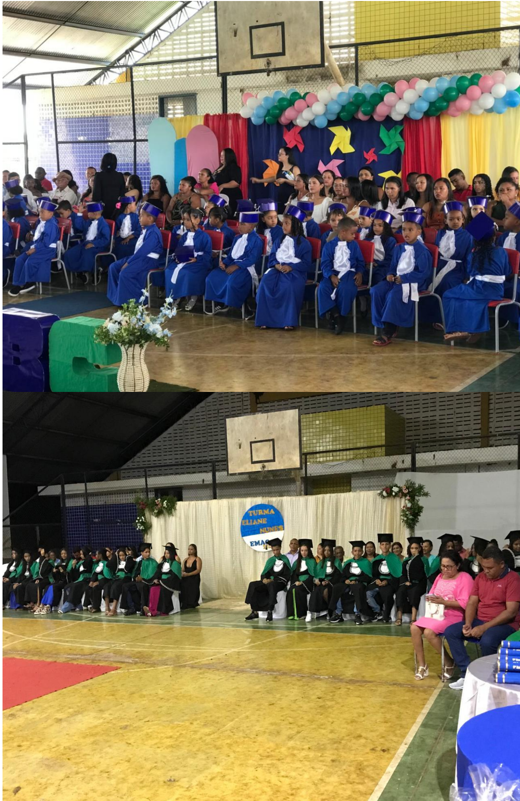
Imagem 22: Formaturas do ABC e do 9º