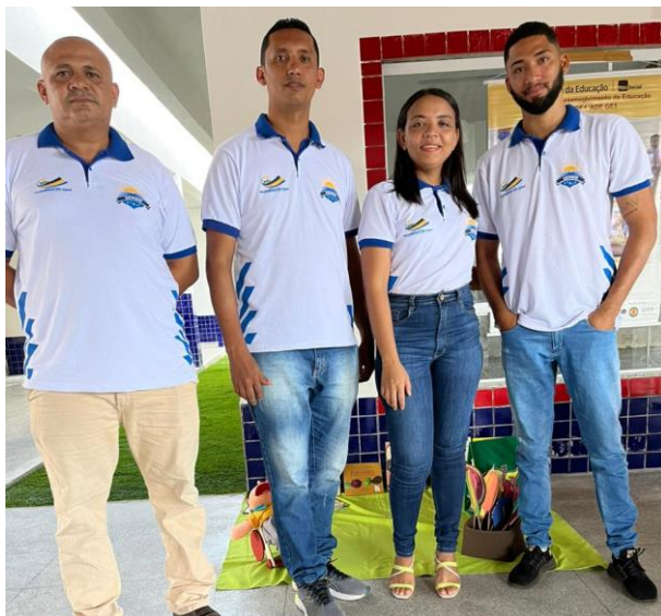
Imagem 11: Inauguração da Creche

Realizou-se a inauguração da Creche Municipal, espaço amplo, no qual é possível atender uma demanda maior de crianças garantindo conforto e segurança.