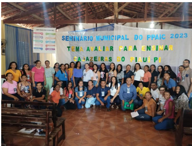
Imagem 14: Seminário do PPAIC

Realizou-se o primeiro Seminário Municipal do Programa Piauiense de Alfabetização na Idade Certa cujo objetivo foi apresentar boas práticas em Alfabetização realizadas pelos professores da rede municipal de ensino.