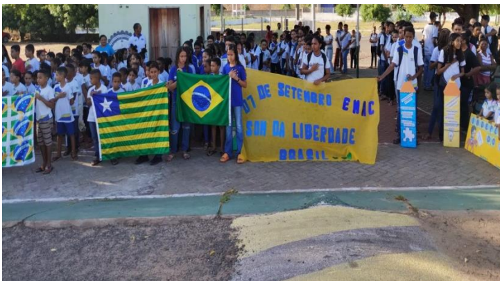
Imagem 16: Planejamento Pedagógico em rede.

Realizou-se o momento alusivo ao movimento da independência com o objetivo de cantar os hinos e realizar atividades de homenagem a Pátria.