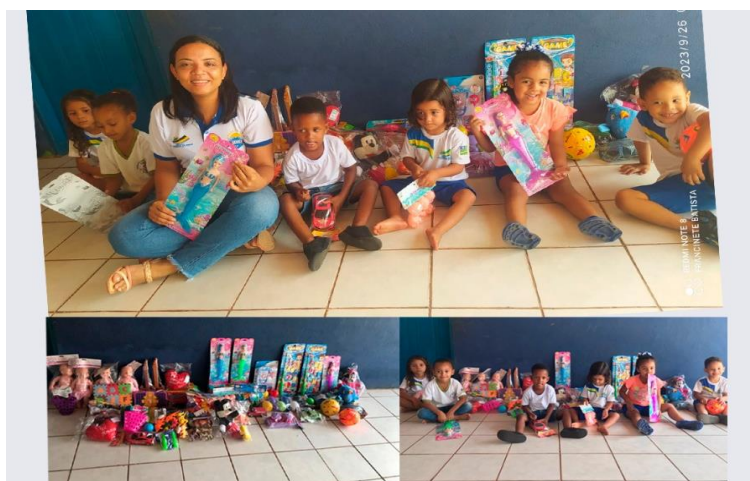
Imagem 18: Aquisição de brinquedos

Realizou-se a aquisição de brinquedos para os estudantes da Escola Municipal Vereador Mazim com o objetivo de estimular a criatividade e a imaginação das crianças facilitando o trabalho dos professores.