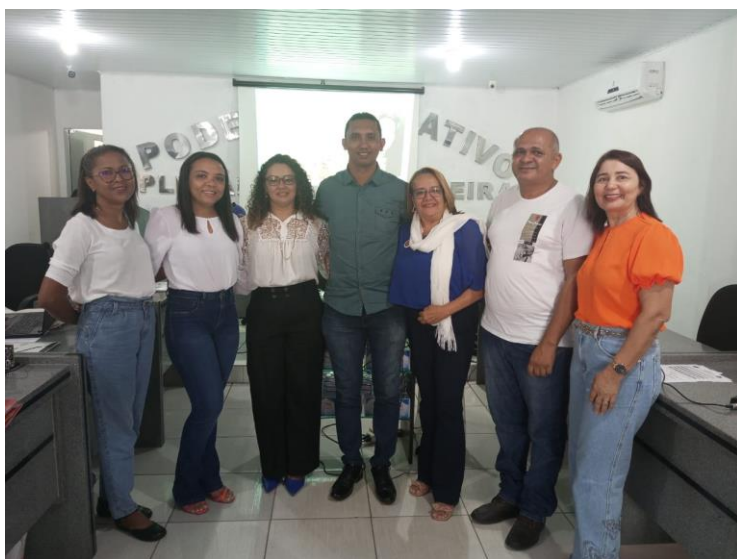
Imagem 05: Formação de Equipe Técnica

A equipe técnica da SEMED esteve no município de Francisco Ayres Piauí para uma das formações que ocorrem através do programa Melhoria da Educação uma parceria entre o Itaú Social e o Instituto Chapada de Ensino (ICEP). Os objetivos das ações é auxiliar os municípios parceiros na política de formação continuada e auxiliar os professores de Língua Portuguesa e Matemática do II ciclo de alfabetização o desenvolvimento das atividades em sala.