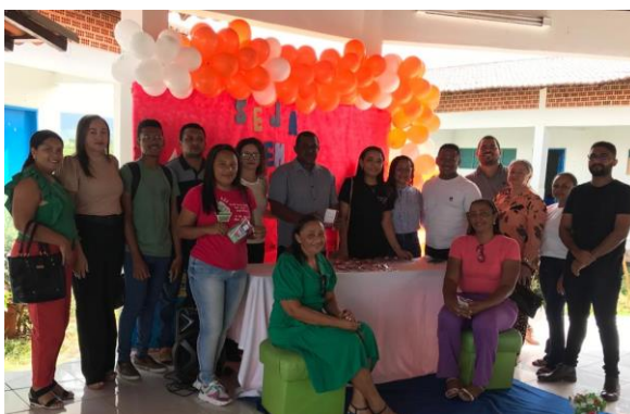
Imagem 03: Jornada pedagógica

Em fevereiro realizou-se um encontro pedagógico com os professores da rede municipal de ensino. Os objetivos da ação foram acolher os docentes tendo em vista o retorno as aulas e a ampliação da jornada de escolar dos estudantes, bem como a implementação do diário digital, informar sobre o calendário do ano letivo, preparar os professores para os planejamentos escolares e ainda sensibilizar os docentes e comunidades escolares sobre a necessidade de receber os estudantes com acolhidas e a realização de planejamentos visando as avaliações externas.