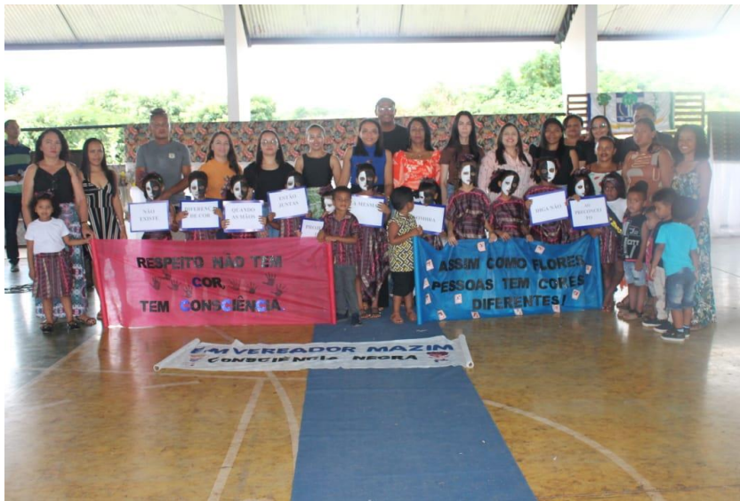
Imagem 21: Culminância de Atividades Integradoras

Realizou-se as culminâncias das Atividades Integradoras as quais foram pautadas na Igualdade Racial e Combate a Discriminação. Os objetivos das atividades as quais tem sido realizados desde o ano de 2021 é integrar a família a escola através de temas transversais e pesquisas na comunidade e família.