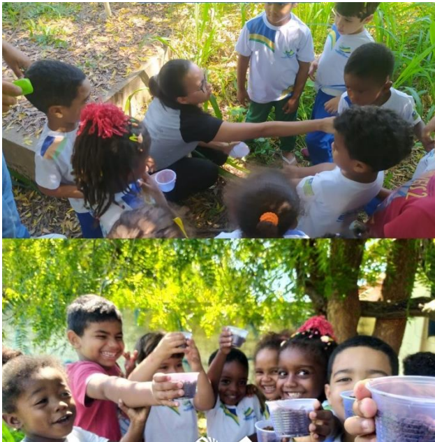
Imagem 09: Semana do Meio Ambiente

Realizou-se através da parceria entre as secretarias municipais de educação e agricultura a semana do meio ambiente com o tema: Sustentabilidade em nossas mãos os objetivos foram sensibilizar as comunidades escolares para os problemas ambientais atuais, desenvolver projetos escolares e realizar a segunda caminhada alusiva ao dia do meio ambiente.