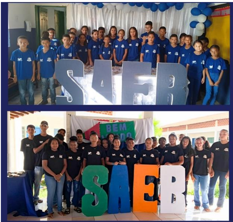
Imagem 21: Realização do SAEB

Realizou-se a aplicação do SAEB com as turmas de 5º e 9º ano do Ensino Fundamental, o objetivo da avaliação é verificar as habilidades dos estudantes no fechamento dos ciclos de Ensino Fundamental nas disciplinas de Língua Portuguesa e Matemática.