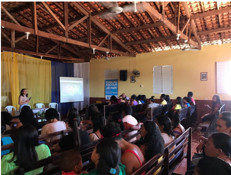
Imagem 15: Planejamento Pedagógico em rede.

A Secretaria Municipal de Educação realizou o planejamento pedagógico para o início das aulas do segundo semestre ação teve objetivo de orientar os professores para avaliar e elencar as habilidades a serem desenvolvidas nos dois meses.