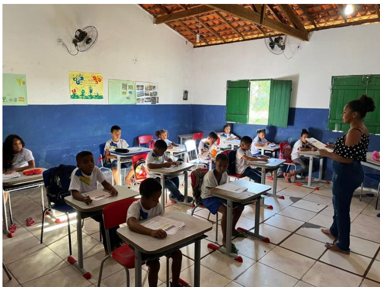
Imagem 13: Avaliação Diagnóstica de rede