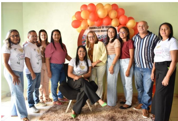
Imagem 08: Formação de Equipe Técnica

A equipe técnica da SEMED esteve no município de Santa Rosa Piauí para uma das formações que ocorrem através do programa Melhoria da Educação uma parceria entre o Itaú Social e o Instituto Chapada de Ensino (ICEP). Os objetivos das ações é auxiliar os municípios parceiros na política de formação continuada e auxiliar os professores de Língua Portuguesa e Matemática do II ciclo de alfabetização o desenvolvimento das atividades em sala.