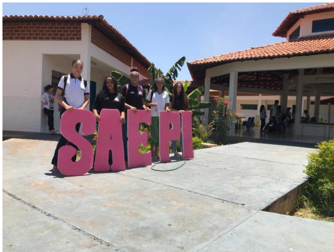
Imagem 19: Estudantes da EMAC para a realização do SAEPI

Realizou-se a aplicação do SAEPI com as turmas de 5º e 9º ano do Ensino Fundamental, o objetivo da avaliação é verificar as habilidades dos estudantes no fechamento dos ciclos de Ensino Fundamental.