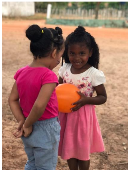
Imagem 20: Dia das Crianças nas Escolas

A Secretaria Municipal de Educação promoveu o Dia das Crianças nas escolas entre os objetivos estava promover um dia de brincadeiras e recreação, ao todo os profissionais da secretaria percorreram 7 escolas de Educação Infantil e anos iniciais do Ensino Fundamental.