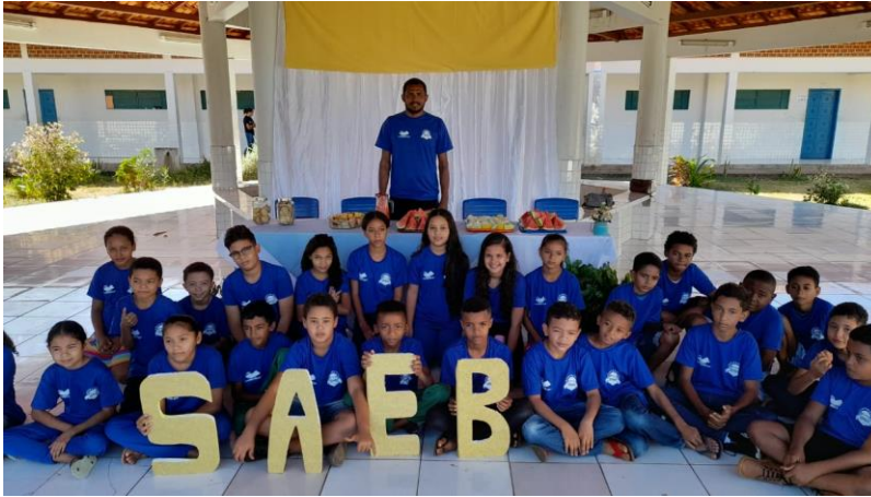
Imagem 12: Revisão para o SAEB

Durante o mês de julho realizou-se revisões com as turmas de 5º e 9º nas disciplinas de Língua Portuguesa e Matemática com o objetivo de preparar os estudantes para o SAEB (Sistema de Avaliação da Educação Básica) na oportunidade foram entregues fardamentos aos estudantes.