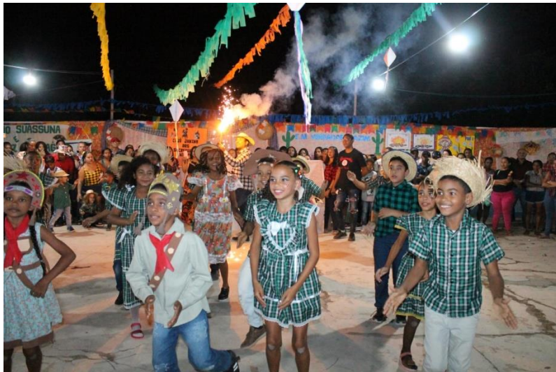
Imagem 10: Festival Junino

da SEMED que também forneceu os para as atividades de modo que todas as escolas da rede municipal puderam participar.