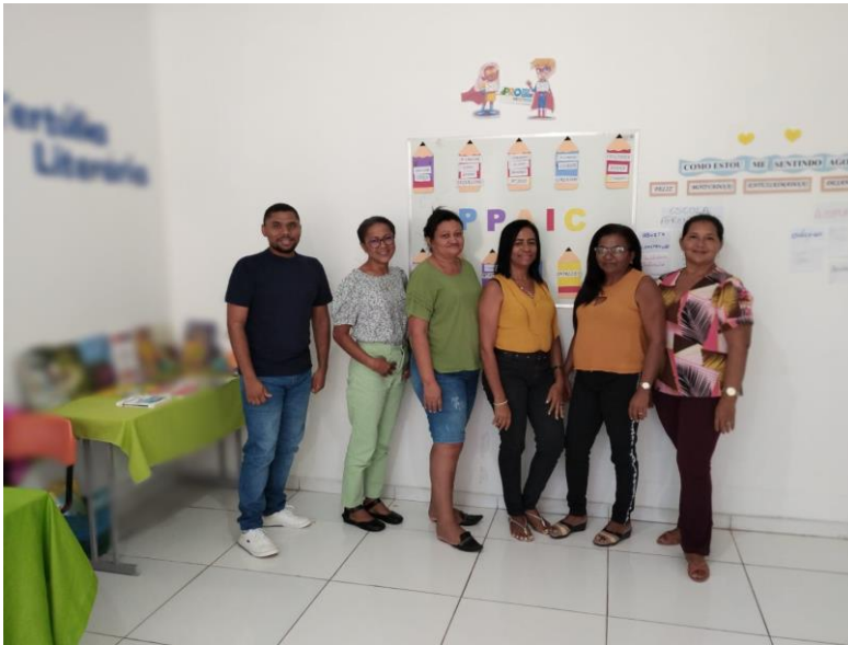
Imagem 06: Formação de gestores escolares através do PPAIC