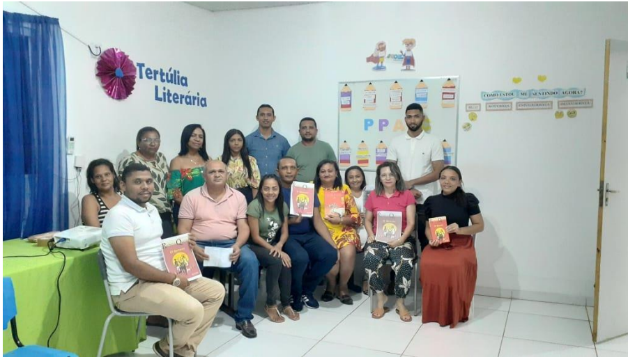
Imagem 02: Formação Inicial de gestores

elaboradas e executadas pela Equipe Técnica da SEMED nos encontros realizou-se as tertúlias literárias.