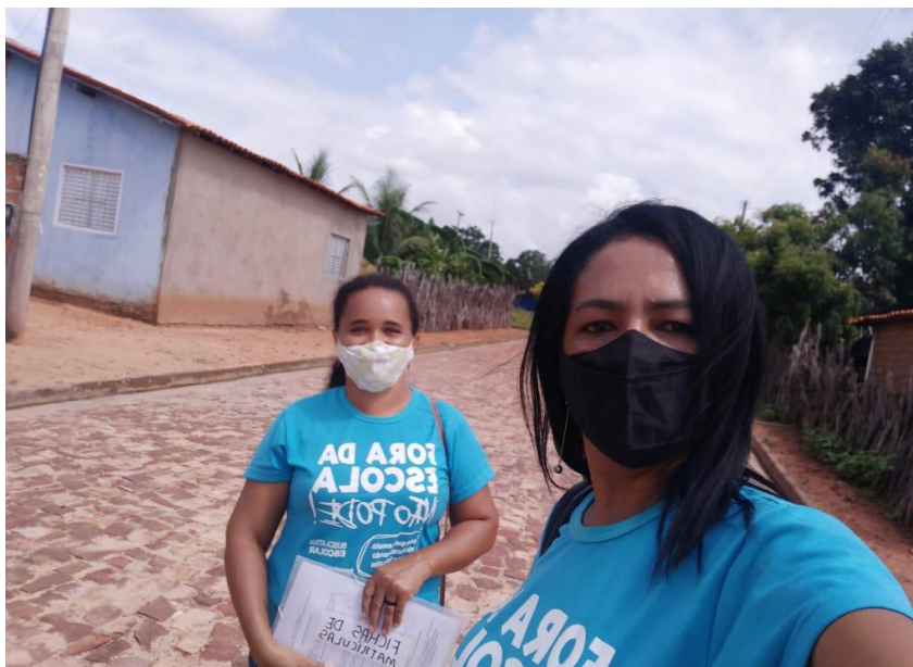
Imagem 01: Busca Ativa Escolar

Durante o mês de janeiro a Secretaria Municipal de Educação (SEMED) realizou a Busca Ativa Escolar (BAE) os objetivos da ação foram garantir a rematrícula de todos os estudantes em idade escolar, despertar a sociedade para a importância da permanência do estudante na escola bem como garantir novas matrículas de modo que todas as crianças, adolescentes, jovens e adultos estivessem devidamente matriculados e frequentando a escola. Ressalta-se que a BAE permaneceu sendo realizada durante todo o ano letivo, em 2023 a SEMED conseguiu garantir as rematrículas e ampliou o atendimento na Educação Infantil.