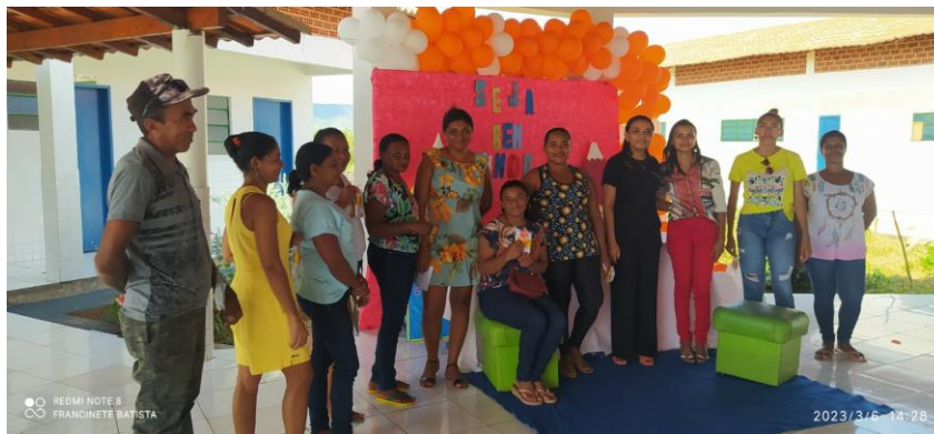
Imagem 04: Formação dos auxiliares dos serviços gerais

A SEMED realizou a primeira formação para os zeladores e merendeiras das escolas da rede municipal de ensino o objetivo foi capacitar os profissionais para a manipulação de alimentos bem como a limpeza dos espaços escolares.