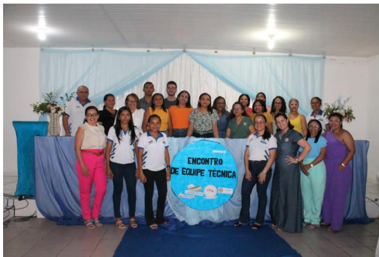
Imagem 17: Encontro de Equipe Técnica

Realizou-se o encontro presencial de equipes técnicas em Cajazeiras do Piauí para uma das formações que ocorrem através do programa Melhoria da Educação uma parceria entre o Itaú Social e o Instituto Chapada de Ensino (ICEP). Os objetivos das ações é auxiliar os municípios parceiros na política de formação continuada e auxiliar os professores de Língua Portuguesa e Matemática do II ciclo de alfabetização o desenvolvimento das atividades em sala.